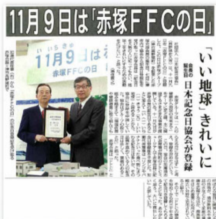
伊勢新聞(2018年11月8日付朝刊)